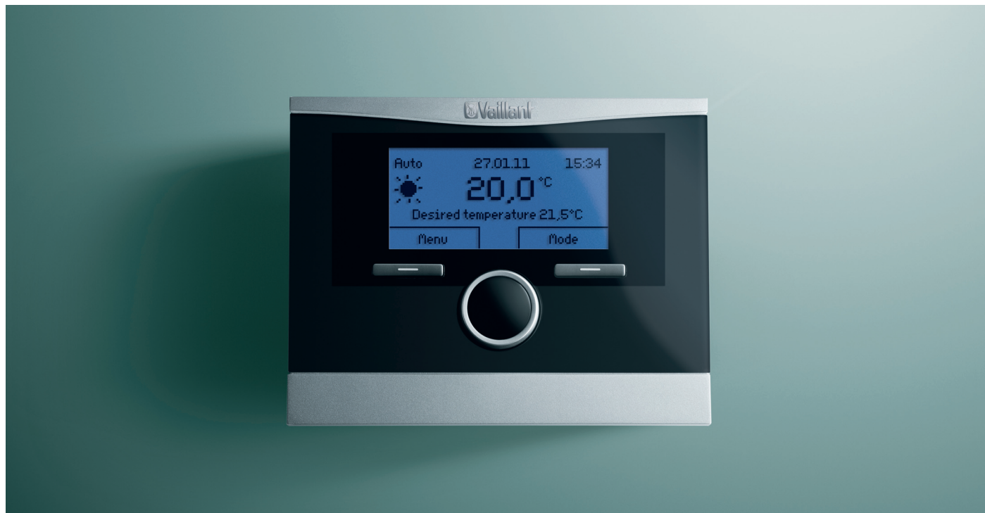
eBus prostorový termostat calorMATIC 370