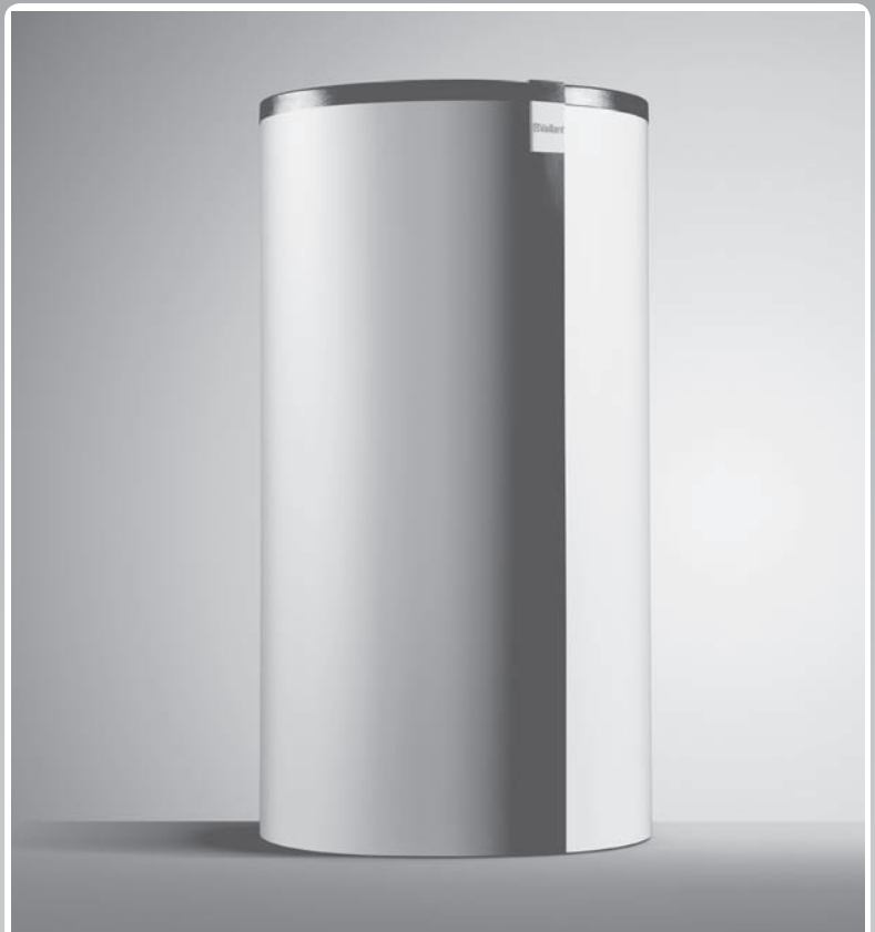
Akumulační zásobník aIISTOR